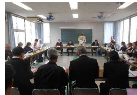
第18回理事会の様子 (令和6年4月27日（土）) 梅田土地区画整理記念館にて