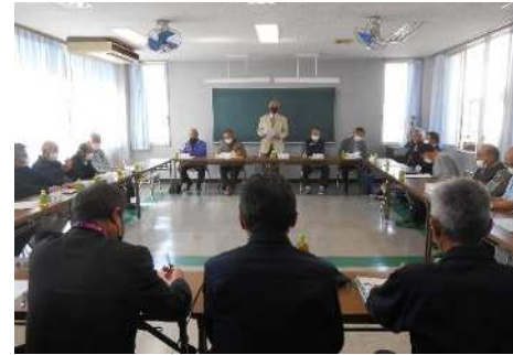
第17理事会の様子 (令和6年3月30日（土）) 梅田土地区画整理記念館にて

第19回理事会では、報告事項として、 ・前年度分4月・5月（出納閉鎖）の収支報告について ・令和6年度4月・5月分収支報告について ・令和5年度における監査について ・(株)大本組から現在における作業状況について 協議事項として、 ・春日部市長への施行に伴う支援に関する要望書の提出について ・春日部市議会議員への施行に伴う支援に関する要望書の提出について 議決事項として、 ・地区内の除草作業について ・第5回総会の開催について ・事務所の火災保険の更新について 上記事項については、全員賛成で、可決いたしました。