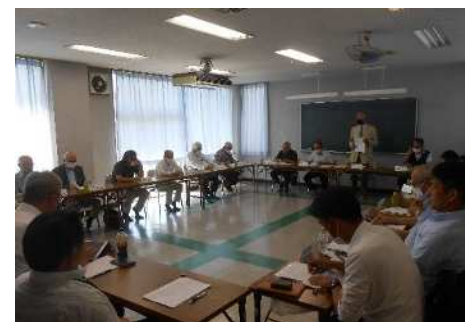
第19回理事会の様子 (令和6年6月8日（土）) 梅田土地区画整理記念館にて